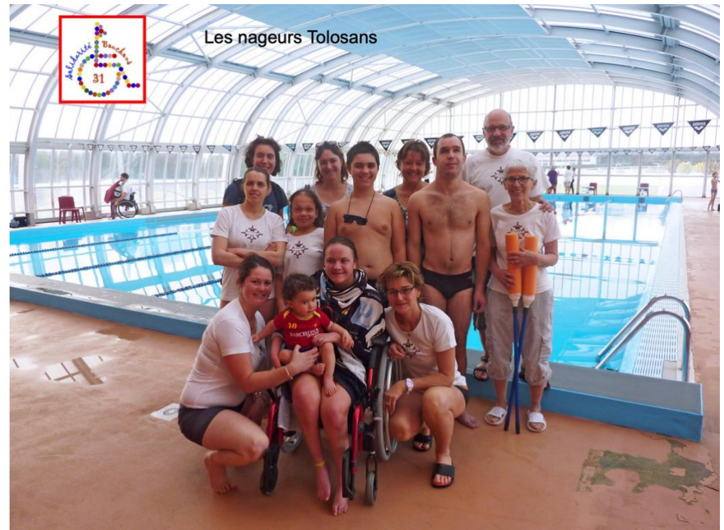
Les nageurs Tolosans